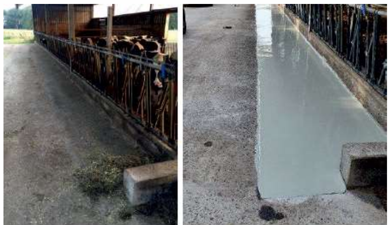
(vorher) / (nachher)

Der Maschinenring Zeven und HANSA Landhandel bieten Ihnen eine Futtertischbeschichtung mit Desical Agro Coating als fertige Arbeit an. Der MR Zeven übernimmt die Arbeiten bis zur Fertigstellung, wir liefern die Produkte für die neue Beschichtung. Ein „sauberer Teller“ kann die Futteraufnahme erhöhen. Der MR koordiniert die Aufträge und Termine, rufen Sie bitte direkt an 04281/93930.