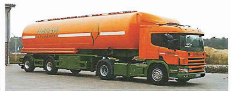
HANSA Fuhrpark mit Qualitätszertifikat

Diese klare Ausrichtung auf die Gesundheit und Sicherheit von Mensch und Tier kommt Tierhaltern und Verbrauchern zugute.