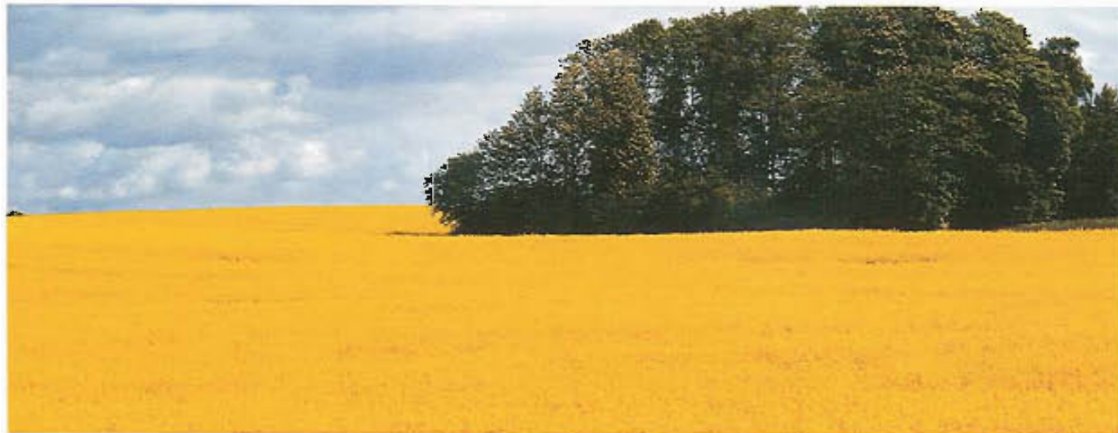
Ertragreiche Bestände durch optimale Nährstoffversorgung

Schon der vorbeugende Einsatz zeigt in den allermeisten Fällen eine hohe Wirtschaftlichkeit.