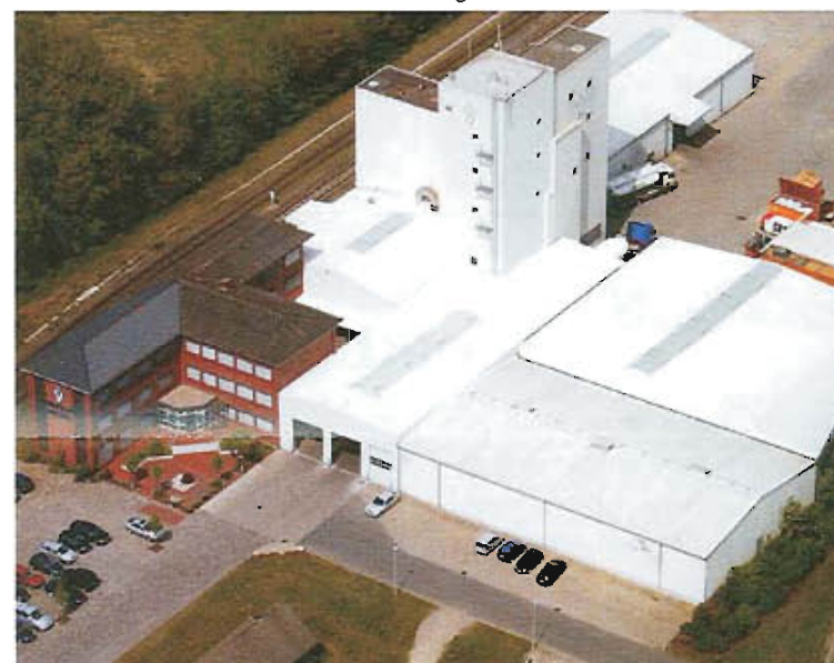
Produktionsstätte der Deutschen Vilomix in Neuenkirchen