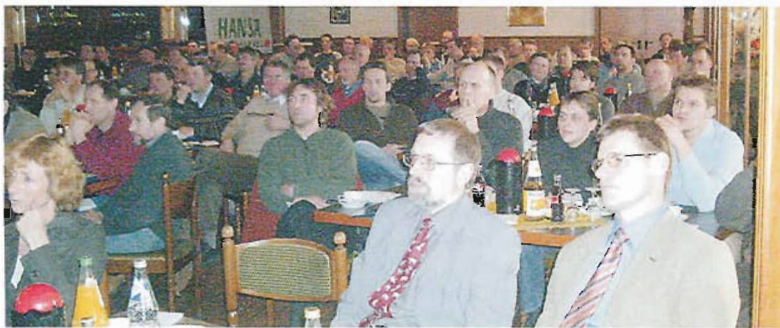
Die Fachtagungen von HANSA Landhandel und SCA waren sehr gut besucht.

len Genetik aus Sicht der Mastschweinevermarktung. Auch die Fachinformationen zu Darmkrankungen in Aufzucht und Mast sind auf ein großes Interesse gestoßen.