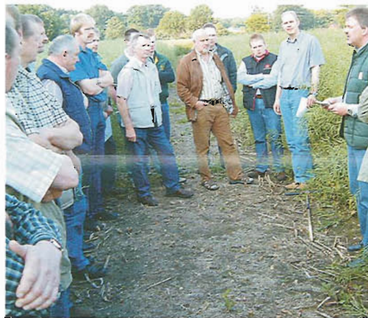
Züchter und Praktiker diskutieren am Feldrand.

Mit einem gemütlichem Grillen, WM-Fußball und interessanten Gesprächen klang der Abend aus.