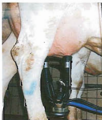
Wichtig: Kontrolle der Melkanlage

Die Kühe zeigten deutliche Verhärtungen in den oberen Euterpartien von Restmilchmengen, die nicht abgegeben wurden. Dazu fanden